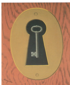
Le sourire du diable (de glimlach van de duivel) Rene Magritte

Ikzelf ben zowel het slot als de sleutel. Bevrijden kan ik mezelf, waarom nog wachten?